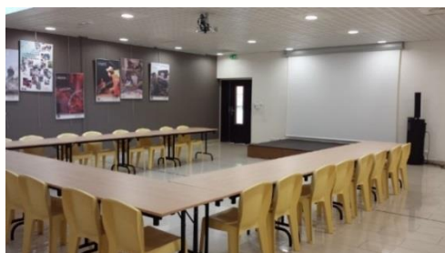
Notre salle de formation sur Toulouse