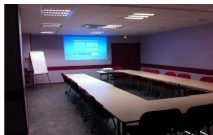
Notre salle de formation sur Montpellier

L'URIOPSS Occitanie dispense des sessions de formation sur Montpellier , dans ses locaux, et Toulouse (dans les locaux de la Résidence Anadyr).