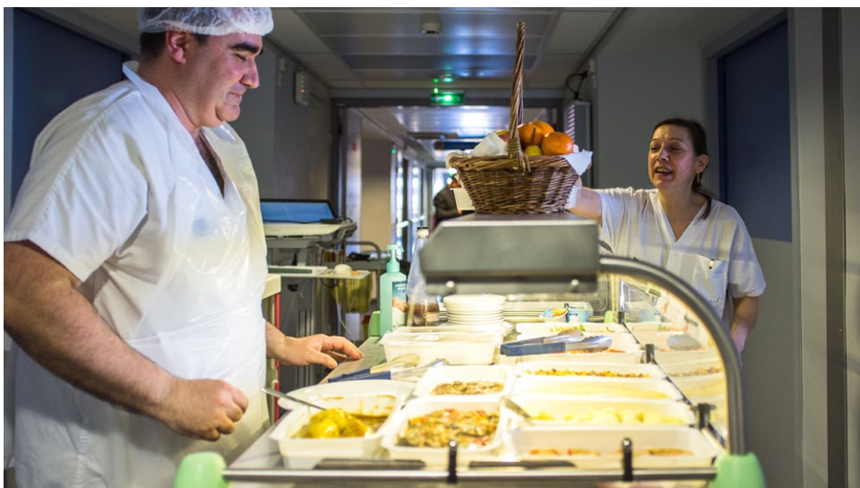
Les patients en long séjour se font servir par des aides-soignants dans le couloir, selon leurs goûts, avec un chariot « maître d'hôtel ». De quoi enthousiasmer les patients : « C'est génial, votre système ! », « Beaucoup plus appétissant que dans les petites barquettes »,... Et leur rendre leur humour : « vous avez oublié l'apéro ? »...